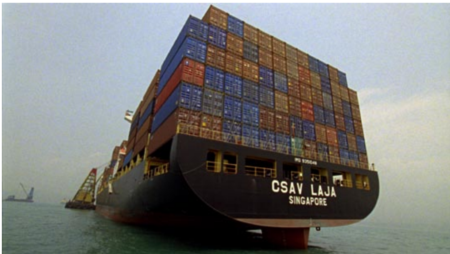
ur The forgotten space, 2010